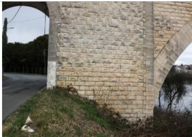
Pont de l'ancienne voie ferrée - pile en rive gauche face amont