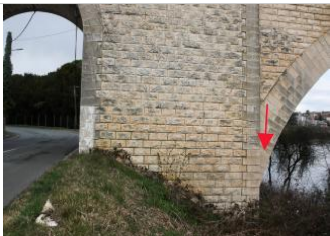
Photographie repère crue 1896

Altitude calculée de l'eau (en m) : 65.82