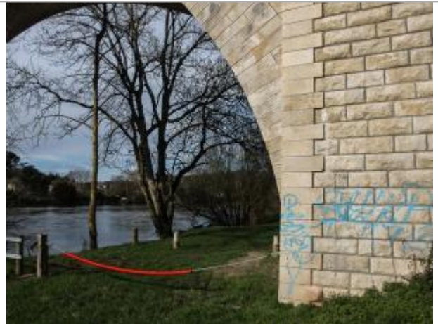
Pont de l'ancienne voie ferrée - pile en rive droite face amont