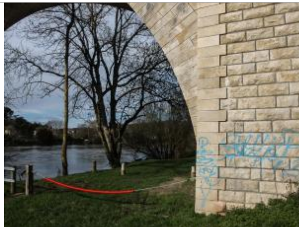
Pont de l'ancienne voie ferrée - pile en rive droite face amont

Coordonnées WGS84 : X: 0.64030601 / Y: 46.56425200