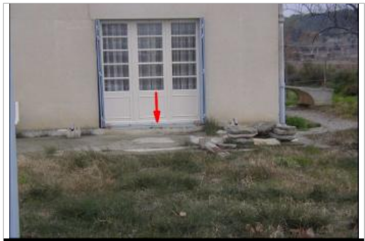
niveau seuil d'entrée

ENQUÊTE DDE - 10/10/2000 Système altimétrique : NGF IGN 1969 (système normal) Altitude de la référence (en m) : 73.370 m Différence entre le niveau d'eau et la référence (en m) : 0.200 m Altitude calculée de l'eau (en m) : 73.57