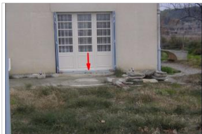
niveau seuil d'entrée

Altitude calculée de l'eau (en m) : 73.57