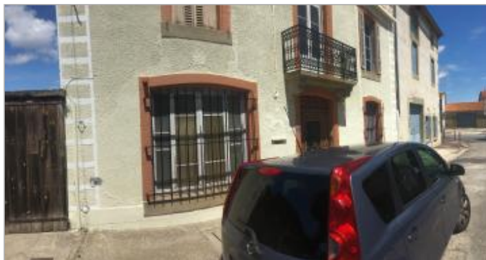
Façade du bâtiment