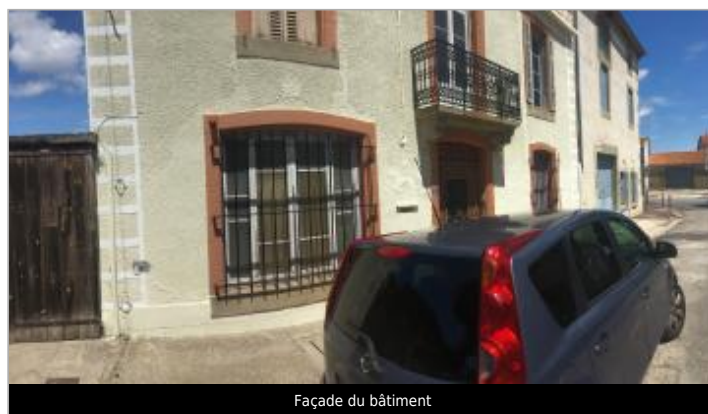
Façade du bâtiment

GÉOLOCALISATION Coordonnées WGS84 : X: 2.52183340 / Y: 43.26997000 Coordonnées RGF93 (Lambert 93) X: 661157 / Y: 6241316.43 Coordonnées RGF93 (ETRS89) : X: 2.5218334 / Y: 43.26997 Code Hydro: Y1421920 Rive de référence: