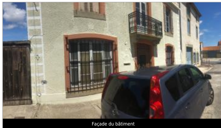
Façade du bâtiment

GÉOLOCALISATION Coordonnées WGS84 : X: 2.52183340 / Y: 43.26997000 Coordonnées RGF93 (Lambert 93) X: 661157 / Y: 6241316.43 Coordonnées RGF93 (ETRS89) : X: 2.5218334 / Y: 43.26997 Code Hydro: Y1421920 Rive de référence: