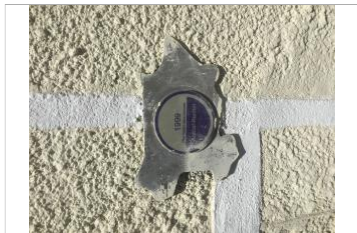
Façade du bâtiment

GÉNÉRAL Code : DDTM11_MV_36 Date de mise à jour : 28/05/2024 Auteur : DDTM 11