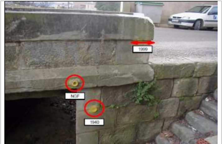
Pont de la RD 111 - Peinture sur parapet amont