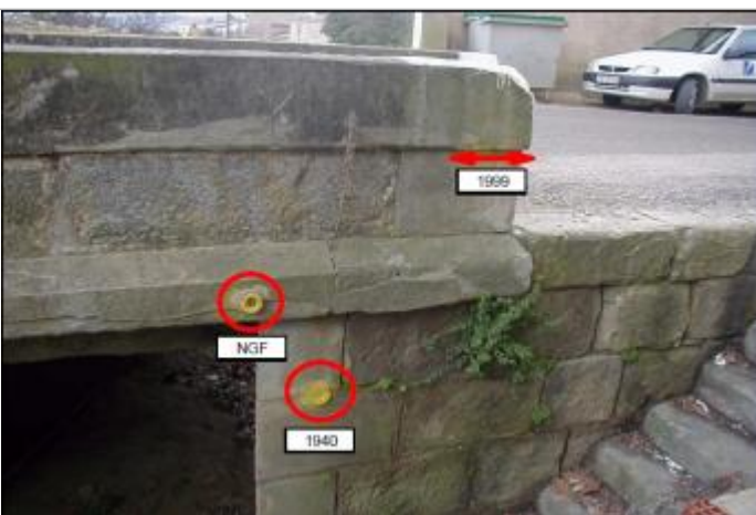
Pont RD 111 - Parapet amont

Altitude calculée de l'eau (en m) : 76.92 m