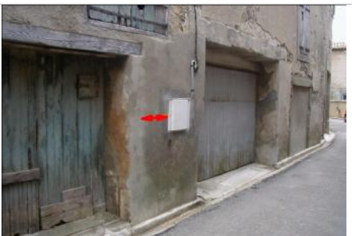
Façade de maison - A gauche coffret EDF

Altitude calculée de l'eau (en m) : 75.73 m