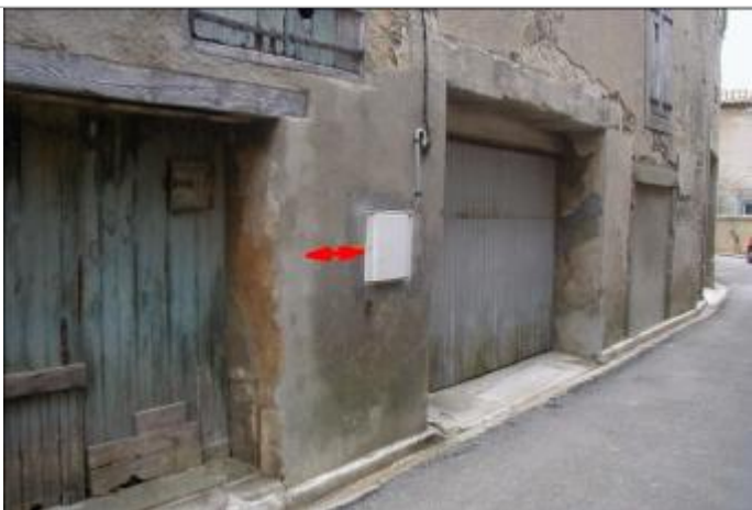
Façade de maison - A gauche coffret EDF

Altitude calculée de l'eau (en m) : 75.73 m