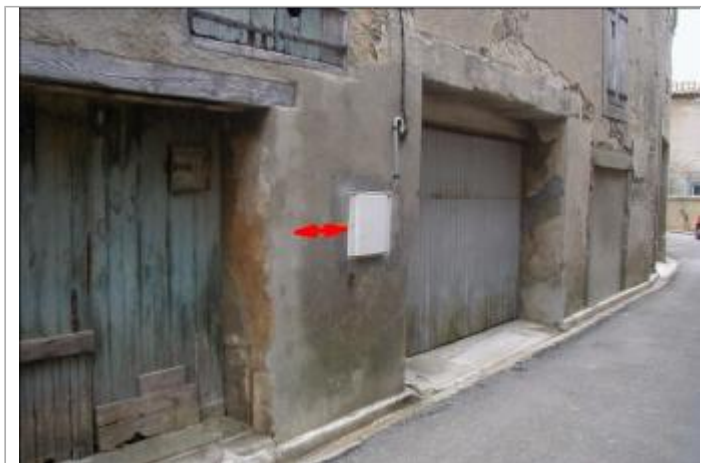
Façade de maison - à gauche du coffret EDF