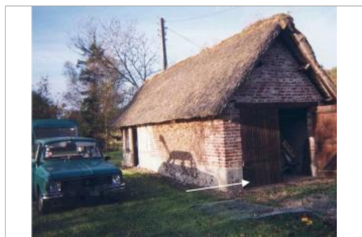
La hauteur d'eau maximale dans le garage a été de 15 cm

MARQUE Maximum de l'inondation : Oui Visibilité : Oui État du repère : Non renseigné Pérennité : Non renseigné