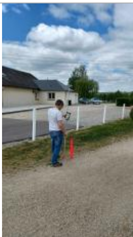
Laisse de crue située devant de la cloture.

Altitude calculée de l'eau (en m) : 22.79 m