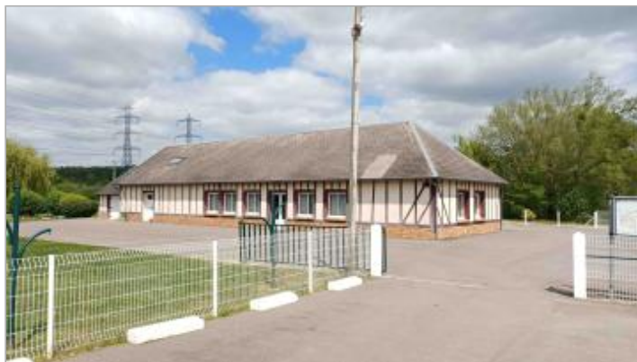
Sol herbeux devant le Centre de formation cynophile.