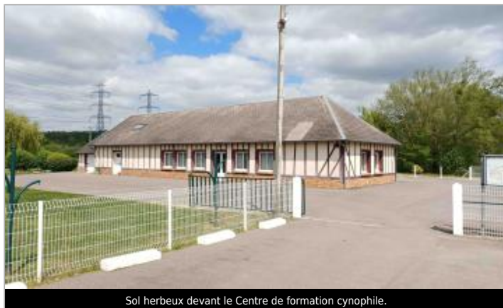
Sol herbeux devant le Centre de formation cynophile.