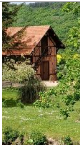
Dependance rue du bateau