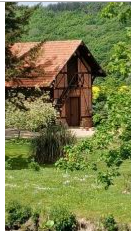
Dépendance rue du bateau

Coordonnées RGF93 (ETRS89) : X: 0.6395408 / Y: 49.310857