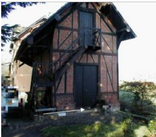
L'eau est arrivée juste en dessous du seuil de la porte.