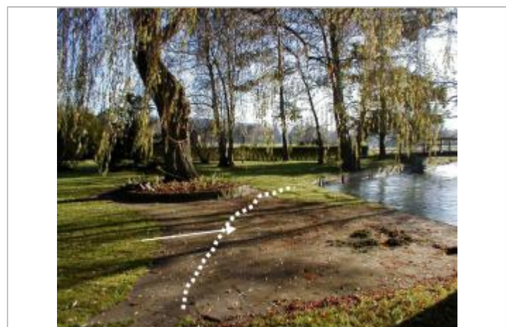
Au plus fort de la crue, l'eau est arrivée à peu près au milieu de la terrasse située en bordure de la Risle

MARQUE Maximum de l'inondation : Oui Visibilité : Non État du repère : Non renseigné Pérennité : Non renseigné