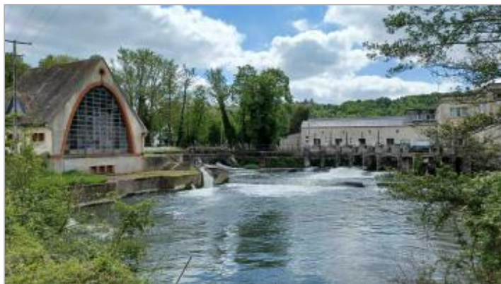
Fenêtres du soubassement du bâtiment de l'Installations hydroélectriques situées derrière les usines au lieu-dit de la "Cahotterie".