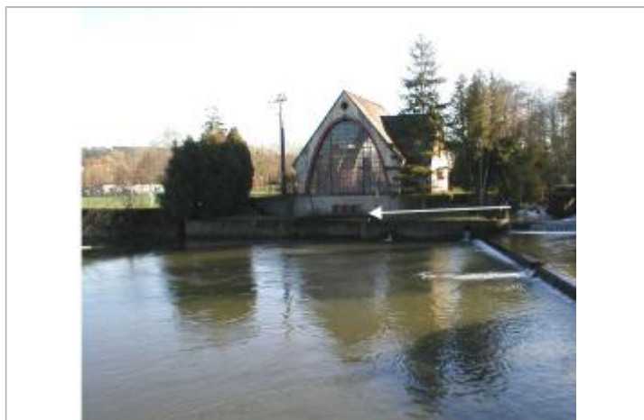
Au maximum, l'eau arrivait en bas des petites fenêtres du bâtiment

SOURCE DE REPÉRAGE : ETUDE HYDRAULIQUE DE LA RISLE AVAL - 01/12/2002