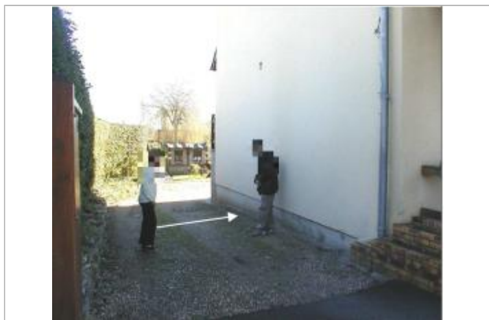
Les plus hautes eaux connues s'arrêtaient au niveau indiqué sur la photographie