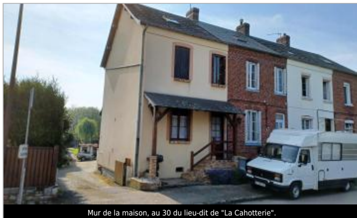
Mur de la maison, au 30 du lieu-dit de "La Cahotterie".