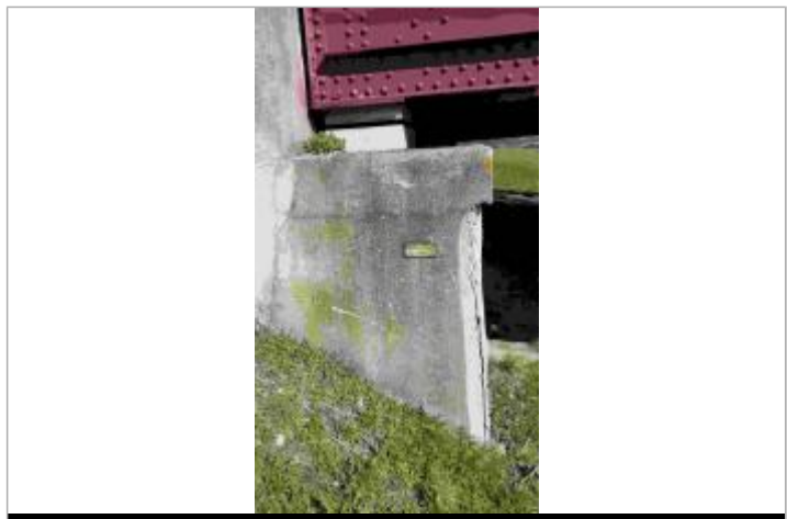
plaque repère de la crue de 1983