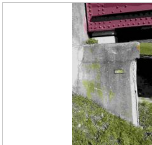
plaque repère de la crue de 1983