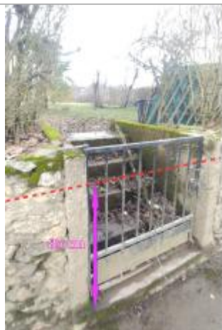
Vue de la marque - Auteur : SCHAPI

Altitude calculée de l'eau (en m) : 73.7 m