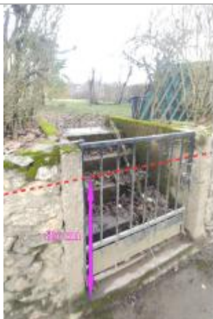
Vue de la marque - Auteur : SCHAPI

Altitude calculée de l'eau (en m) : 73.7 m