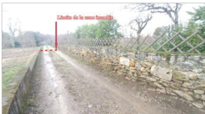
Vue de la marque - Auteur : SCHAPI