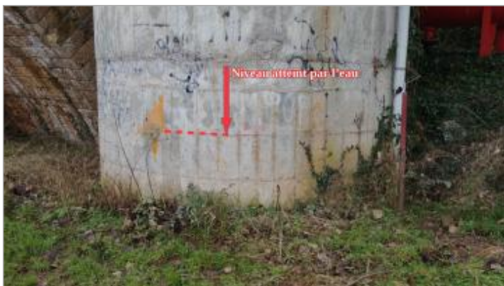
Vue de la marque - Auteur : SCHAPI