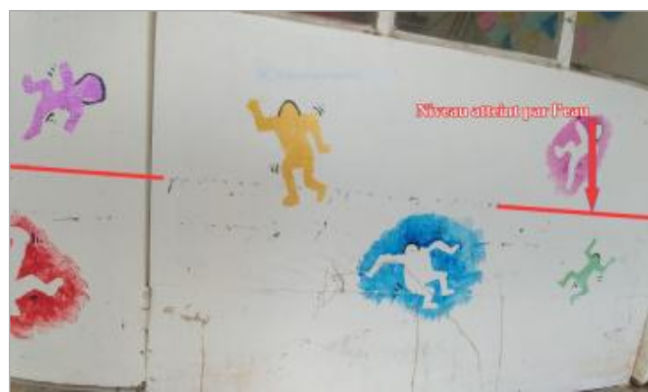
Vue de la marque - Auteur : SCHAPI

GÉNÉRAL Code : VEZ_01-18_R_010_1 Date de mise à jour : 15/02/2021 Auteur : SPC GTL