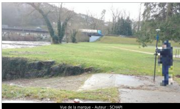
Vue de la marque - Auteur : SCHAPI

Code : VEZ_01-18_R_005_1 Date de mise à jour : 20/12/2019 Auteur : SPC GTL