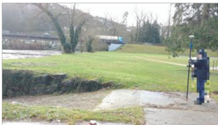
Vue de la marque - Auteur : SCHAPI