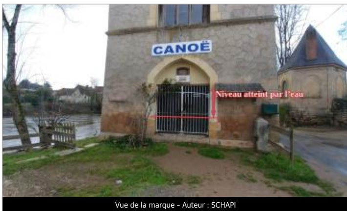
Vue de la marque - Auteur : SCHAPI

Type de repérage : Campagne de terrain post-inondation