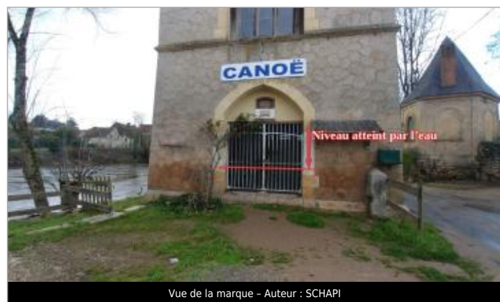
Vue de la marque - Auteur : SCHAPI

GÉNÉRAL Code : VEZ_01-18_R_023_1 Date de mise à jour : 28/10/2021 Auteur : SPC GTL