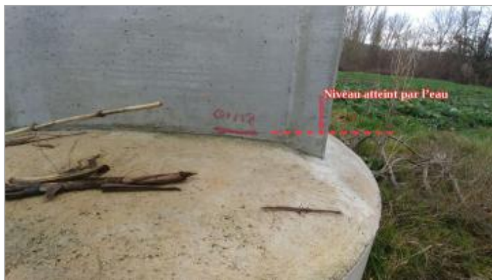
Vue de la marque - Auteur : SCHAPI