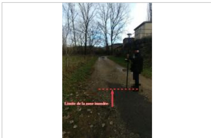
Vue de la marque - Auteur : SCHAPI