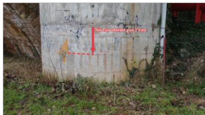
Vue de la marque - Auteur : SCHAPI

GÉNÉRAL Code : VEZ_01-18_R_017_1 Date de mise à jour : 28/10/2021 Auteur : SPC GTL