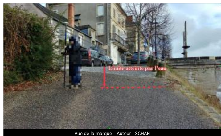
Vue de la marque - Auteur : SCHAPI

GÉNÉRAL Code : VEZ_01-18_R_008_1 Date de mise à jour : 15/02/2021 Auteur : SPC GTL