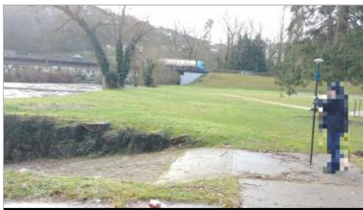
Vue de la marque - Auteur : SCHAPI

Code : VEZ_01-18_R_005_1 Date de mise à jour : 20/12/2019 Auteur : SPC GTL