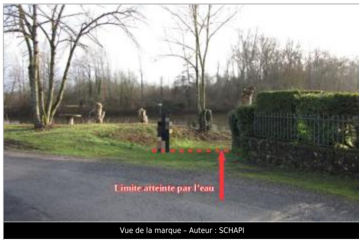
Vue de la marque - Auteur : SCHAPI