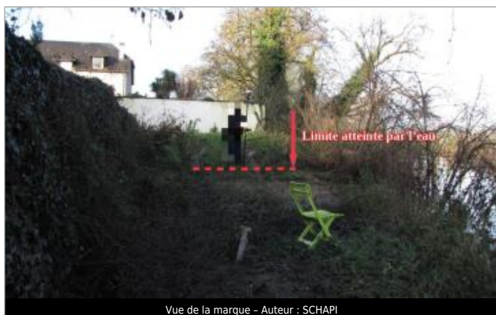
Vue de la marque - Auteur : SCHAPI