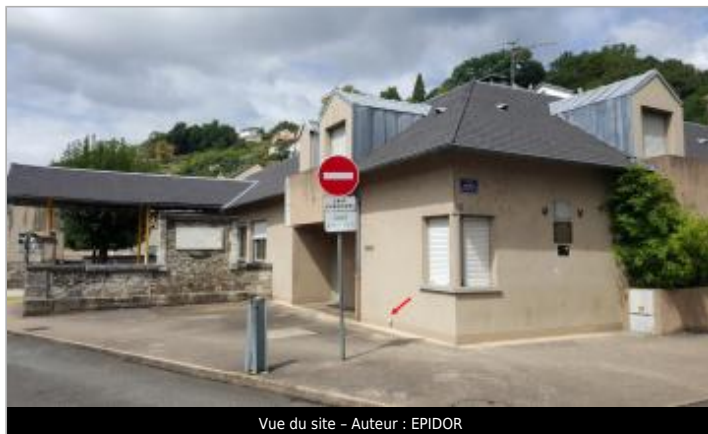
Vue du site - Auteur : EPIDOR