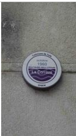
Vue du repère - Auteur : EPIDOR

Altitude calculée de l'eau (en m) : 214.54