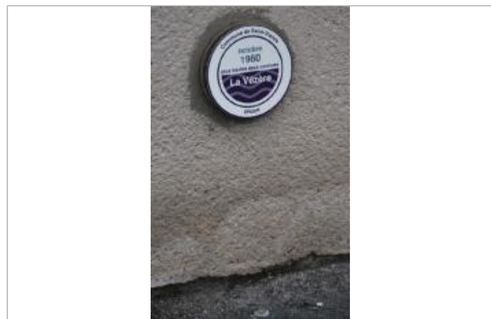
Vue du repère - Auteur : EPIDOR

GÉNÉRAL Code : EPIDOR_R_19246-1_1 Date de mise à jour : 25/08/2022 Auteur : M. Thomas - EPIDOR