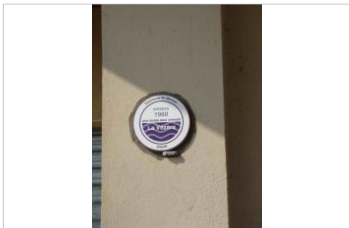
Vue du repère - Auteur : EPIDOR

Altitude calculée de l'eau (en m) : 92.08