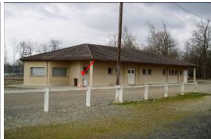
Vue du site - Auteur : EPIDOR

Coordonnées WGS84 : X: 1.36552400 / Y: 45.13680830