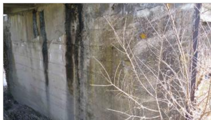
plaque sur 3ème pile de pont, rive gauche, côté amont