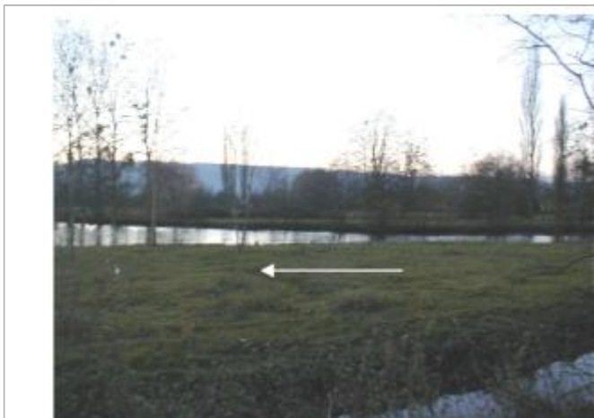
Il y a eu 15 cm d'eau au milieu de la parcelle

Maximum de l'inondation : Oui Visibilité : Oui État du repère : Non renseigné Pérennité : Non renseigné