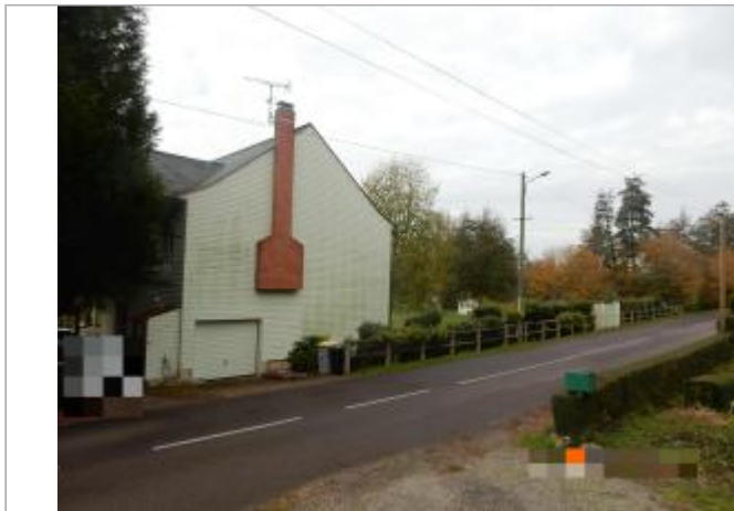
Habitation au 69 rue Saint-Vincent