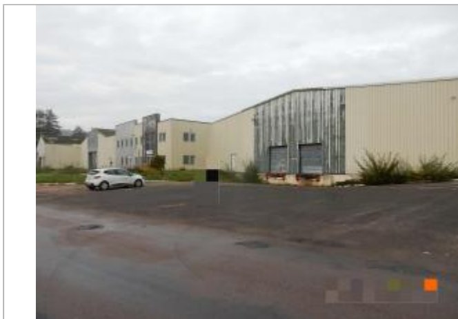
Parking de l'ancienne usine de conditionnement