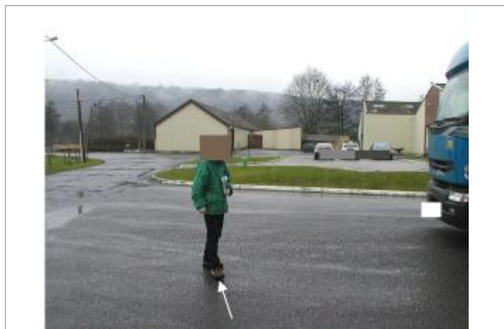
La limite des plus hautes eaux se situe sur le parking devant l'usine