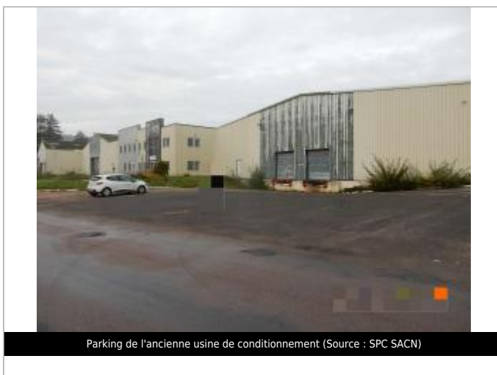
Parking de l'ancienne usine de conditionnement