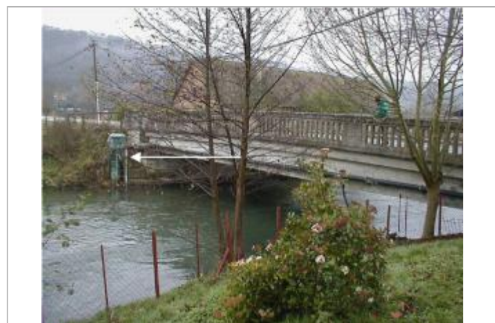
La hauteur d'eau maximale, enregistrée à la Banque HYDRO, est de 1650 mm

GÉNÉRAL Code : WEB_R_201803140150 Date de mise à jour : 16/04/2018 Auteur : Ghubert