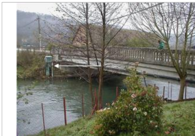
La hauteur d'eau maximale, enregistrée à la Banque HYDRO, est de 1650 mm

SOURCE DE REPÉRAGE : ETUDE HYDRAULIQUE DE LA RISLE AVAL - 01/12/2002