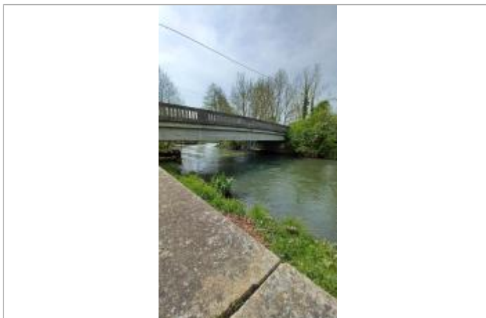
Echelle limnimétrique de la Station hydrométrique située en rive gauche du pont de la RD137 sur la Risle.