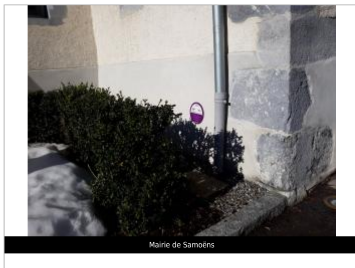
Mairie de Samoëns