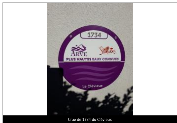
Crue de 1734 du Clévieux