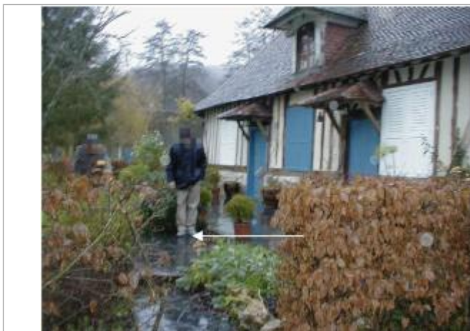
L'eau arrivait sur la terrasse devant l'habitation

Altitude calculée de l'eau (en m) : 61.08 m