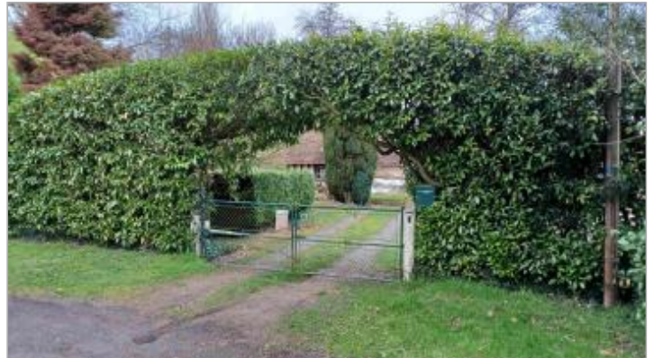
Terrasse de l'habitation au 1 impasse du Catillon