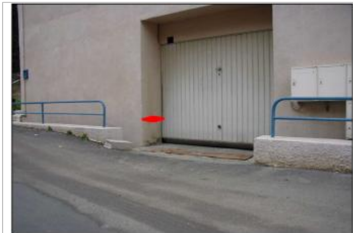
Mur maison parement du portail de garage