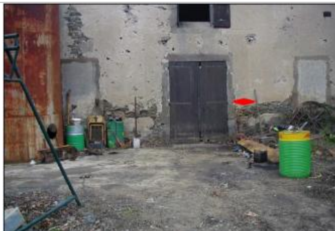
Façade du bâtiment à droite du portail