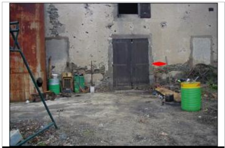
Façade du bâtiment à droite du portail

ENQUÊTE DDE - 20/05/2000 Système altimétrique : NGF IGN 1969 (système normal) Altitude de la référence (en m) : 54.300 m Différence entre le niveau d'eau et la référence (en m) : 1.100 m Altitude calculée de l'eau (en m) : 55.4