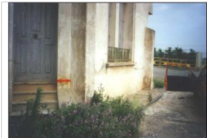
Mur de façade de la distillerie