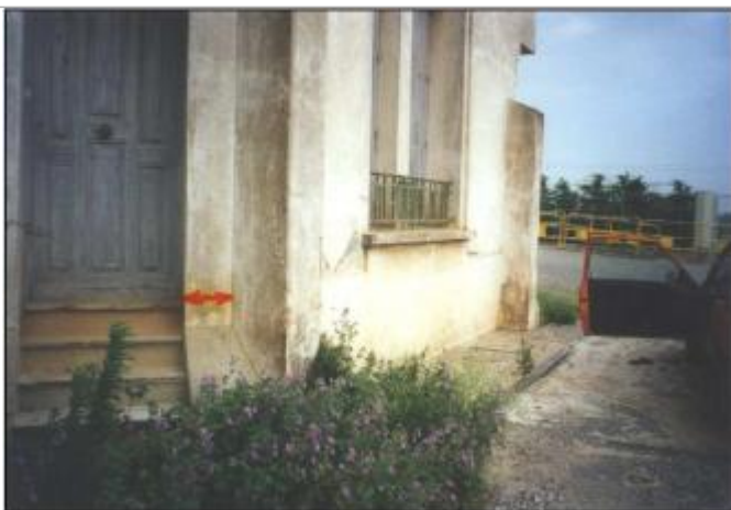
Mur de façade de la distillerie

Altitude calculée de l'eau (en m) : 58.68 m