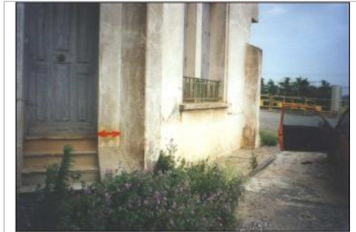
Mur de façade de la distillerie