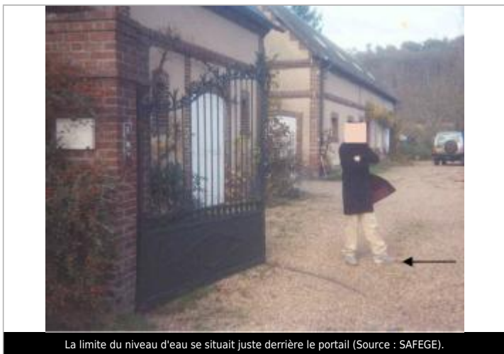
La limite du niveau d'eau se situait juste derrière le portail.