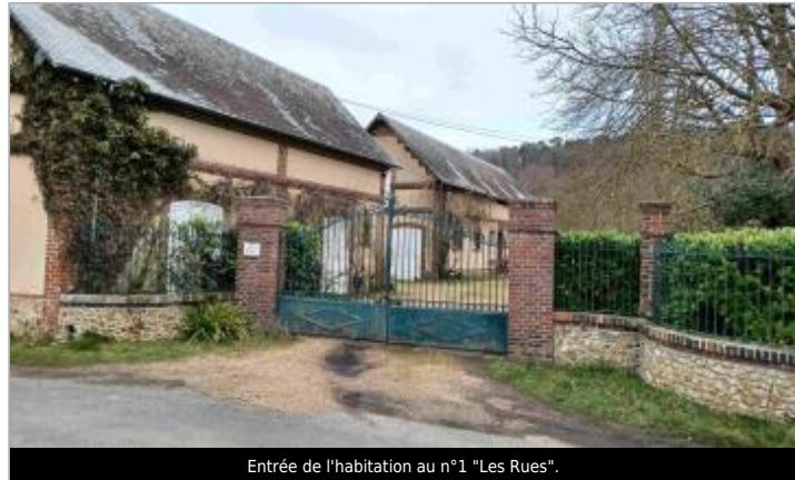
Entrée de l'habitation au n°1 "Les Rues".