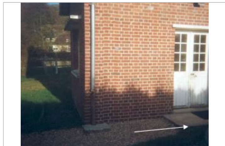
L'eau est montée jusqu'à la marche d'entrée