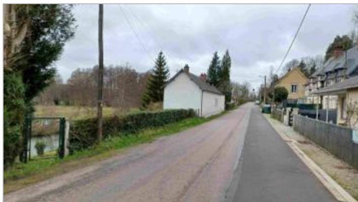
Jardin de l'habitation au 5 route de Nassandres.