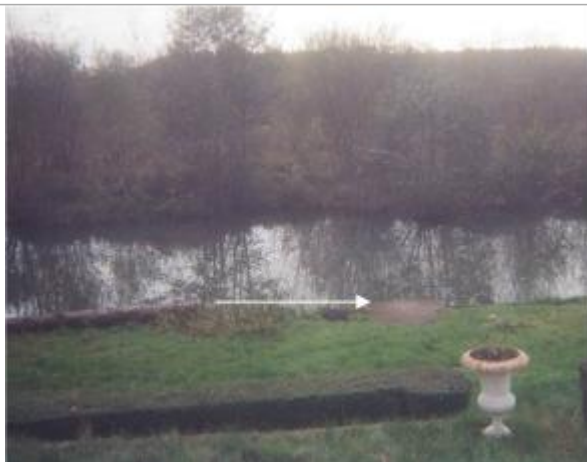
L'eau est montée d'environ 2 cm au-dessus du ponton