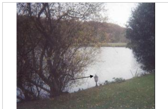
Au plus fort de la crue, seule la pointe du lampadaire émergeait