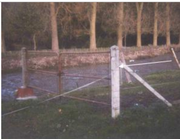
Eau arrivée jusqu'à l'encoche, au-dessus de la bande sur le poteau situé en bout de chemin