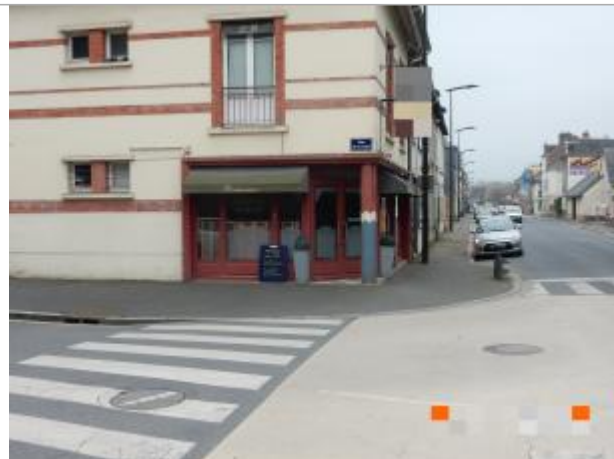
Restaurant au croisement de la rue de la Gare et de la rue Hamelin