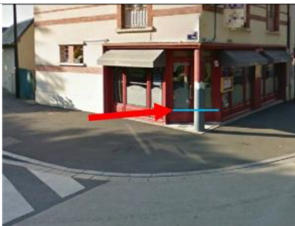
10 cm au-dessus du seuil de la porte d'entrée.

Méthode : GPS Organisme : SPC Seine aval - Côtiers normands Référence nivelée : Autre type de référence Description référence du repère : Niveau du sol devant le restaurant. Système altimétrique : NGF IGN 1969 (système normal) Altitude de la référence (en m) : 10.930 m Différence entre le niveau d'eau et la référence (en m) : 0.100 m Altitude calculée de l'eau (en m) : 11.03